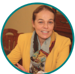
Anne Laperrouze conseillère départementale