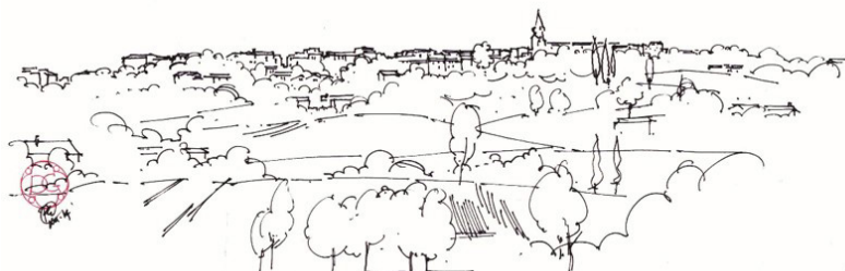
La silhouette de Puylaurens vue de la route de Lantès